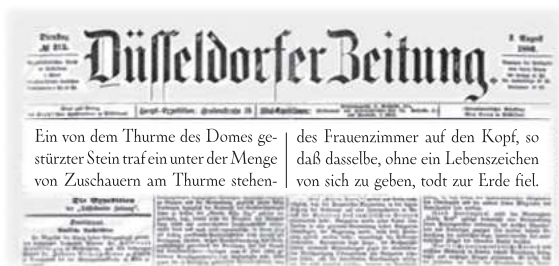
Meldung in der Düsseldorfer Zeitung am 17. August 1848